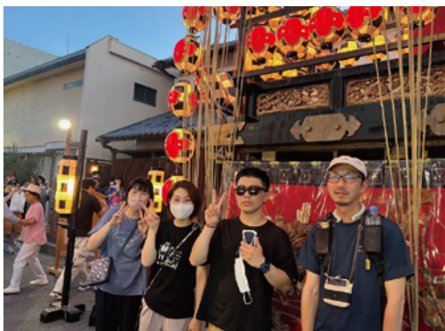
ハートフルハウス創 7月27日(土) 粉河祭り

TEL(073)474-2466 FAX(073)474-4637 http://www.muginosato.jp