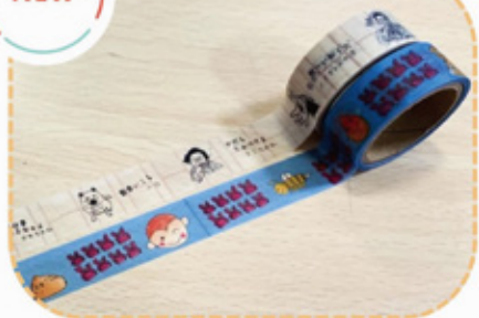
ゆるさん&段子さんの マスキングテープ 各種 ¥400 (税込)