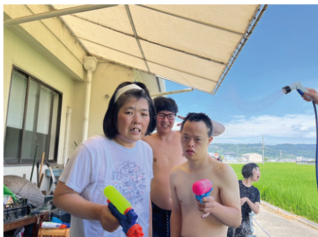
くろしお作業所 7月30日(火) 夏本番! 水遊び!