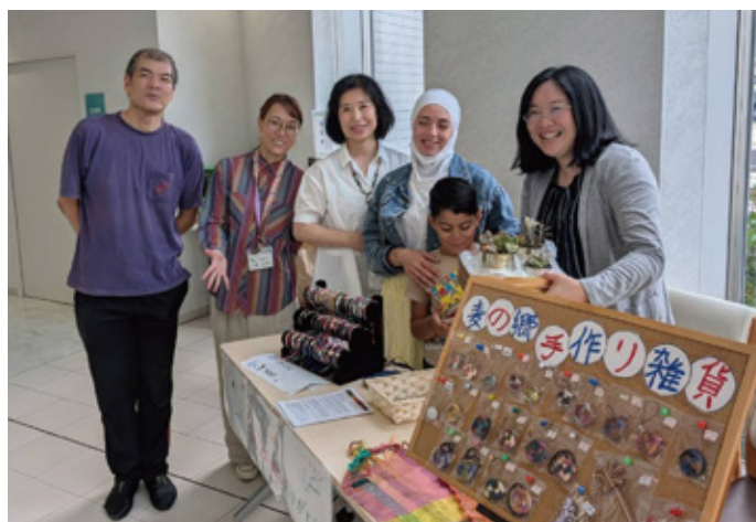
紀の川生活支援センター 7月30日(火) 名手病院にて販売