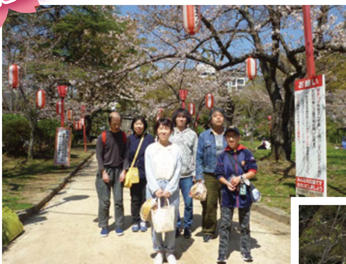
和歌山生活支援センター 4月1日(月) 和歌山城