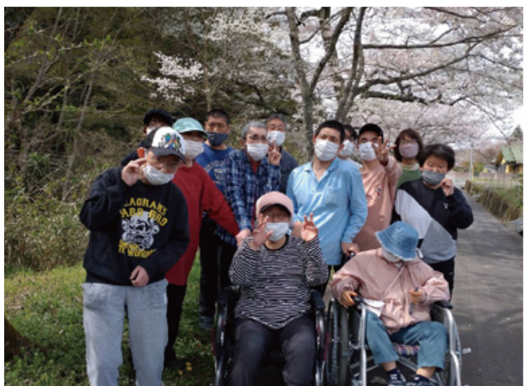
くろしお作業所 4月2日(火) 根来の桜並木